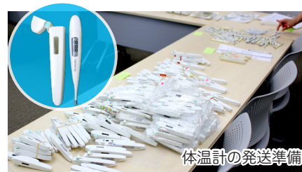
体温計の発送準備