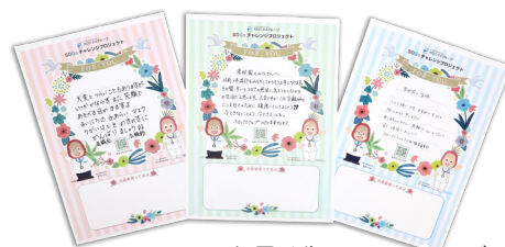
お届け先へのメッセージ

2030年のゴールにむけて、医療法人医誠会、ホロニクスヘルスケア株式会社、インテリジェントヘルスケア株式会社、ホロニクスグループ全職員がSDGsチャレンジャーとして走り続けます。